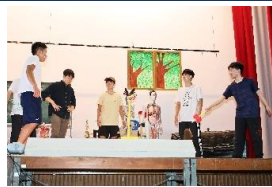
9月 文化祭(一般公開:調整中)・体育祭