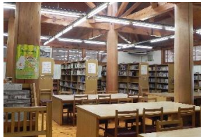
オール京都産材 学校図書館