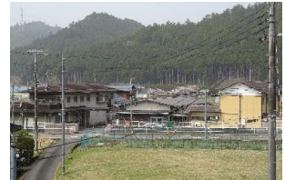
有山寮(就学目的寮:男女)