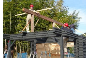
校外ログハウス建築実習