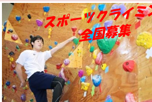
公式大会可能ボルダリング施設

教育目標: 豊かな自然と安心・安全な学習環境の中で、じっくり学習に取り組み、地域の人々・自然・産業・伝統行事等との出会いに心を動かされる体験を通して、自らの進路を開拓していく勇氣と学力を伸ばします。