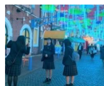
ハウステンボス散策